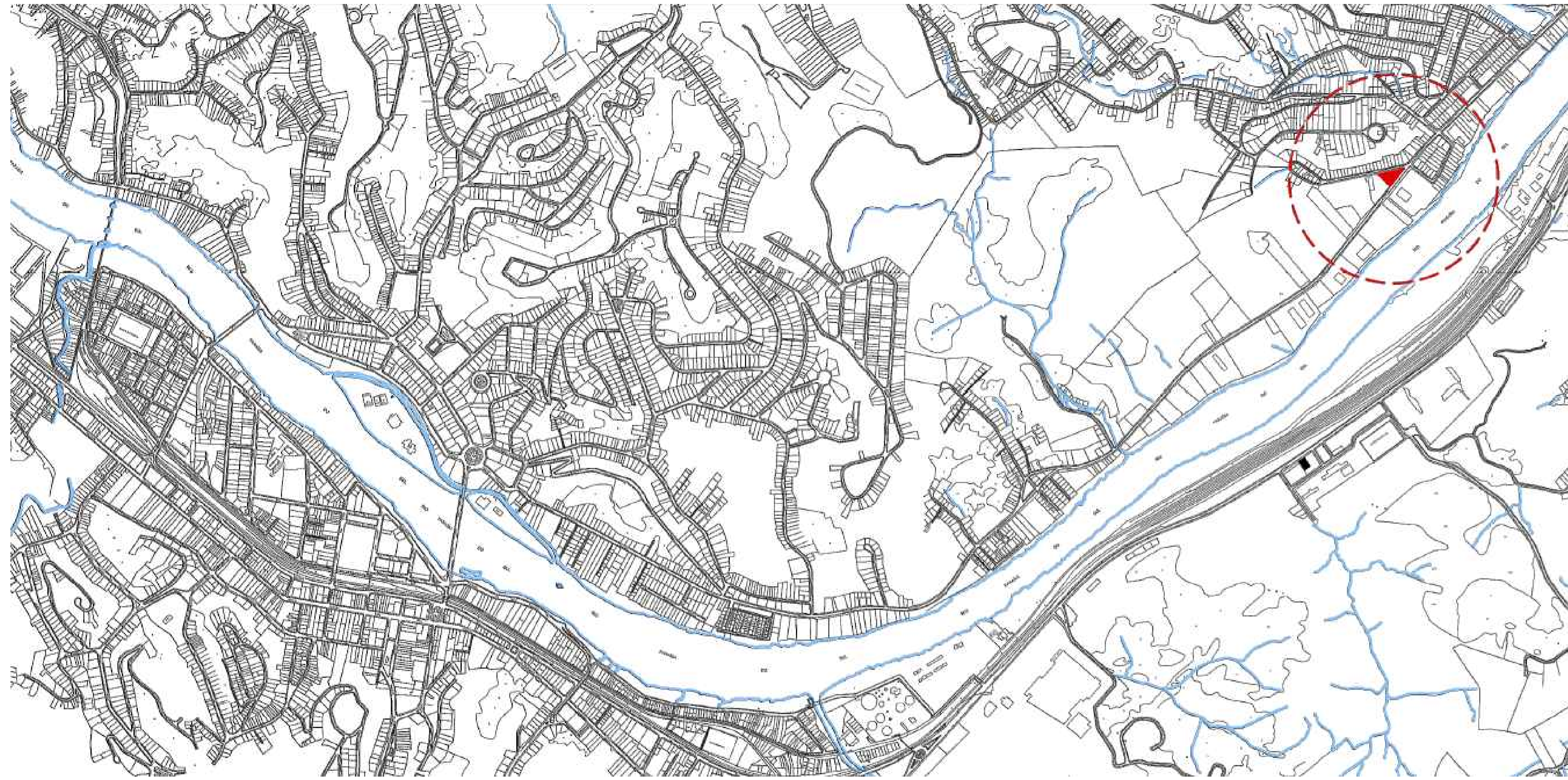
PLANTA DE LOCALIZAÇÃO - CIDADE DE BARRA MANSA S/ ESCALA