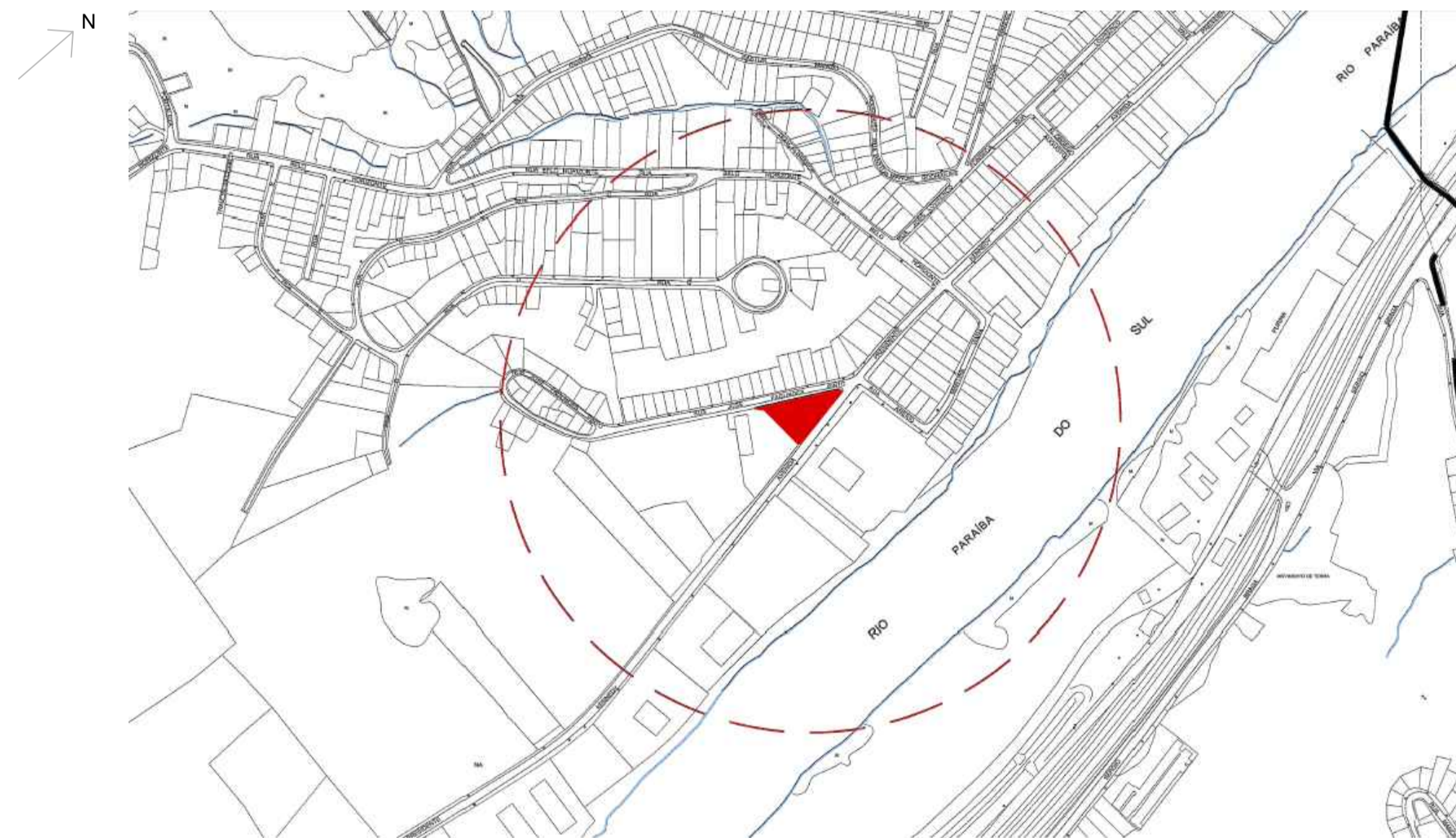
PLANTA DE LOCALIZAÇÃO - BAIRRO GETÚLIO VARGAS S/ ESCALA